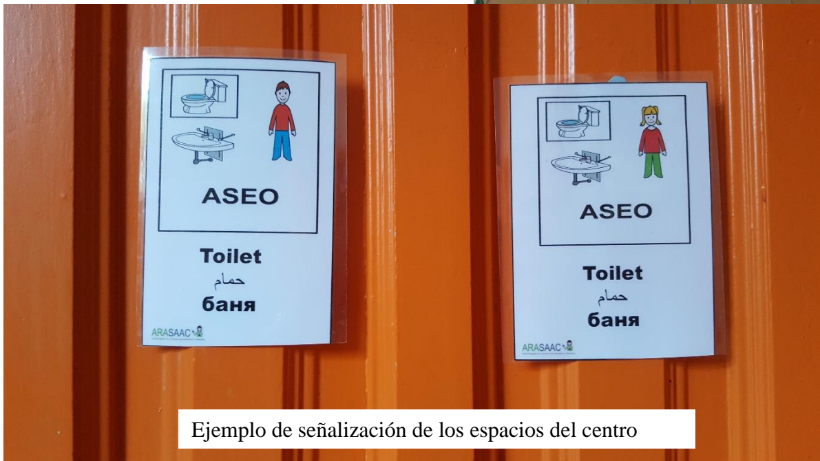
Ejemplo de señalización de los espacios del centro