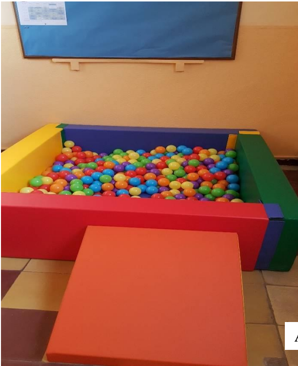
Aula Apoyo Clas