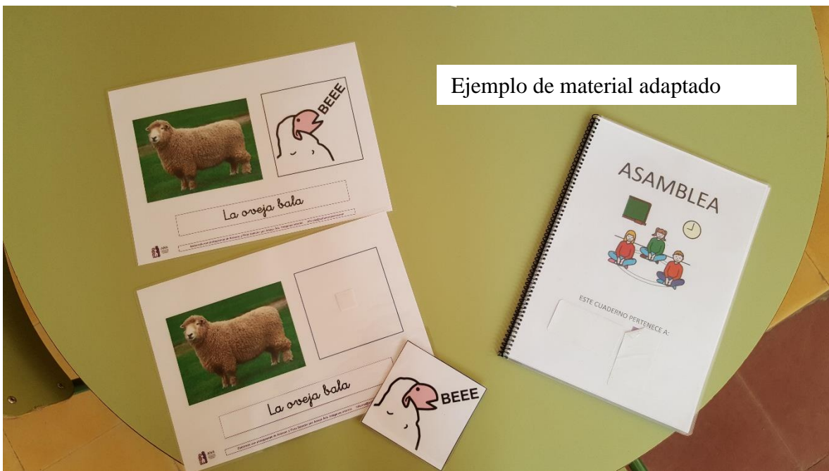
Ejemplo de material adaptado