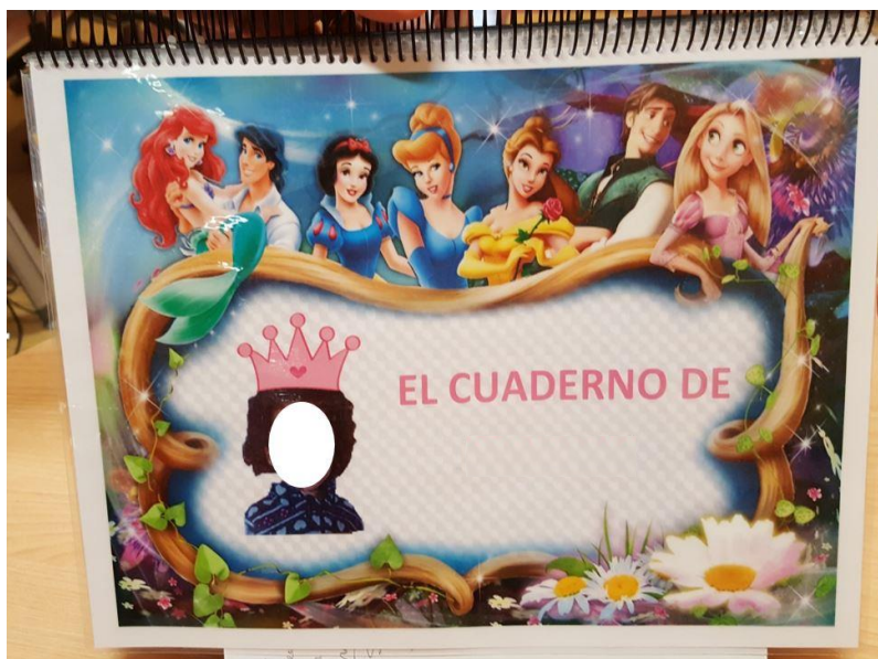
Cuaderno personal de anticipación