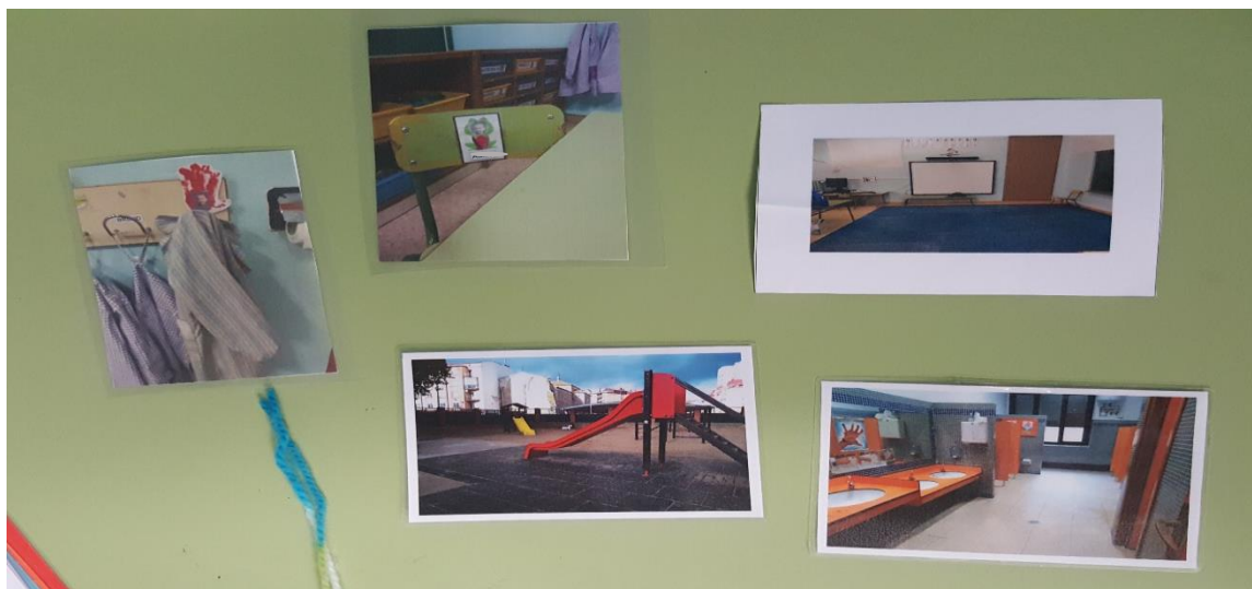
Identificación de espacios habituales del centro